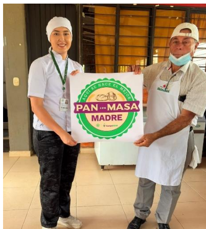
Foto 3. Foto final con el sello.