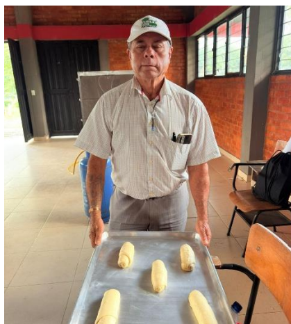
Foto 2. Elaboración de pan.